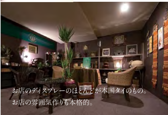
お店のディスプレイのほとんどが本国タイのもの。 お店の雰囲気作りも本格的。

た雰囲気と、スタッフの自然な接遇が、より安心感を与えてくれるところに人気の秘密があるのかもしれない。